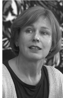
Uri Avnery, Abed Othman, Inge Günther

Das Flüchtlingsproblem, glaube ich, wird sehr realpolitisch gelöst werden, braucht aber eine prinzipielle Anerkennung der 1948 von Israel vollzogenen Vertreibung, eine Art historischer Entschuldigung.